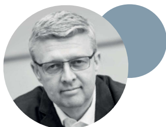
Karel Havlíček vicepremiér pro ekonomiku a ministr průmyslu a obchodu

99 Cirkulární ekonomika je pro průmysl a podnikání v České republice velkou příležitostí i výzvou zároveň. Podmínkou pro zajištění surovinové bezpečnosti je účinné využívání zdrojů, a proto je jednou z priorit Ministerstva průmyslu a obchodu, které zodpovídá za surovinovou politiku státu. Strategické cíle a úkoly v této oblasti stanovuje Surovinová politika ČR v oblasti nerostných surovin a jejich zdrojů a zejména aktualizovaná Politika druhotných surovin ČR.