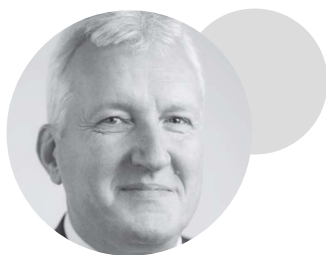
Petr Konvalinka ředitel Technologické agentury ČR

99 Snahou Technologické agentury ČR je podporovat inovativní nápady, které zvyšují konkurenceschopnost naší země a zajišťují lepší budoucnost nás všech. Považujeme tedy za důležité implementovat principy udržitelnosti a cirkulární ekonomiky. Podle expertů je oběhové hospodářství byznys modelem budoucnosti. V Česku ale zatím jeho rozšíření brání zejména levné skládkování a nedostatečná legislativní podpora. Podporu projektů s cirkulární tematikou proto vnímáme jako naši osobní zodpovědnost vůči generacím, které přijdou po nás.