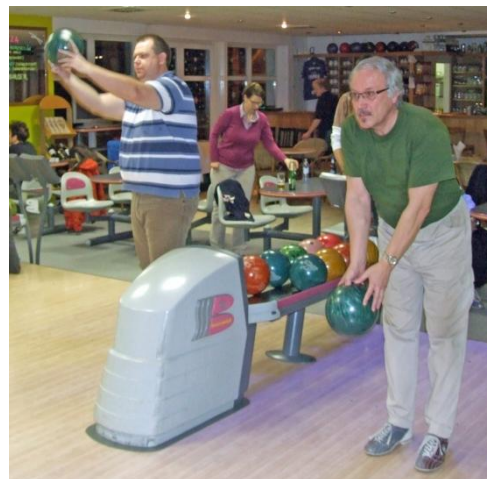
Odlišné styly přípravy na odhod koule