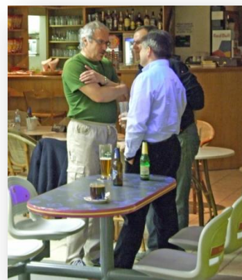
taktická porada 1. družstva