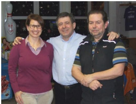
spokojení vítězové závěrečného kola soutěže

Celková bilance čtyřkolové závěrečná rezignace druhého družstva soutěže, která byla neskutečně vyrovnaná, znamenala, že se každý ze zúčastněných členů našeho klubu nejméně jednou dostal do vítězného družstva, takže přispěl k vítězství v některém kole soutěže. Proto tentokrát nebylo poražených a do svých domovů se vraceli pouze vítězové. Přátelská pohodová atmosféra provázela celý příjemně strávený společný večer. Věříme, že si příští soutěžní bowlingové klání nenechají ujít ti naši členové, kterým se tentokrát nepodařilo, se naší tradiční klubové akce zúčastnit.