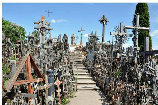
Hora křížů litevsky Kryžiu kalnas