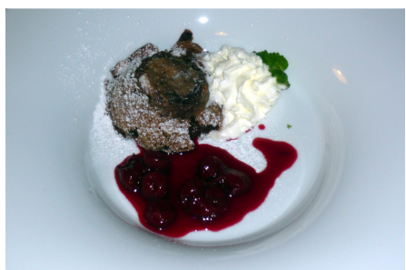
Sladká tečka na konec ☺