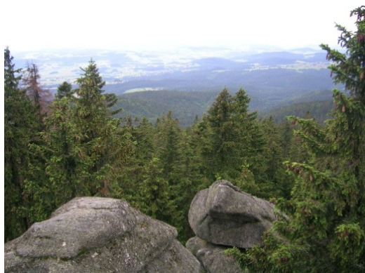
Ilustrační foto: Výhled z Třístoličnicku

z Číny nadšený co všechno za poslední roky se v Číně změnilo. Připraví prezentaci na některé další klubové setkání.