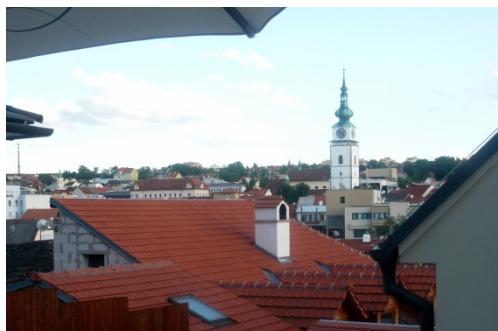
Pohled z terasy Hotelu Joseph 1699