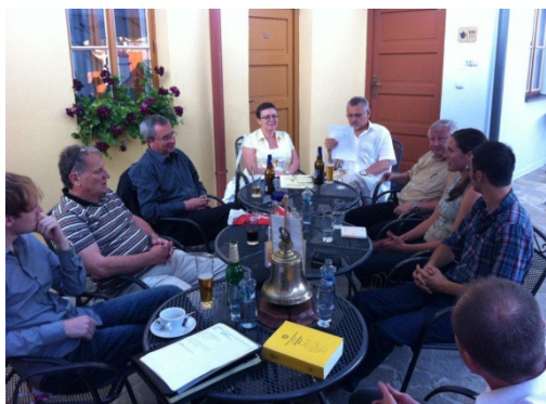
7. letní setkání na terase Hotelu Joseph 1699