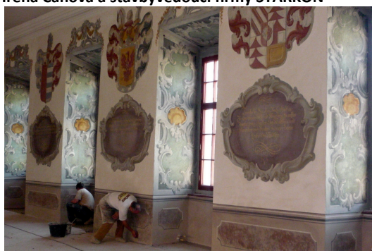
Poslední restaurační práce v Kamenném sále